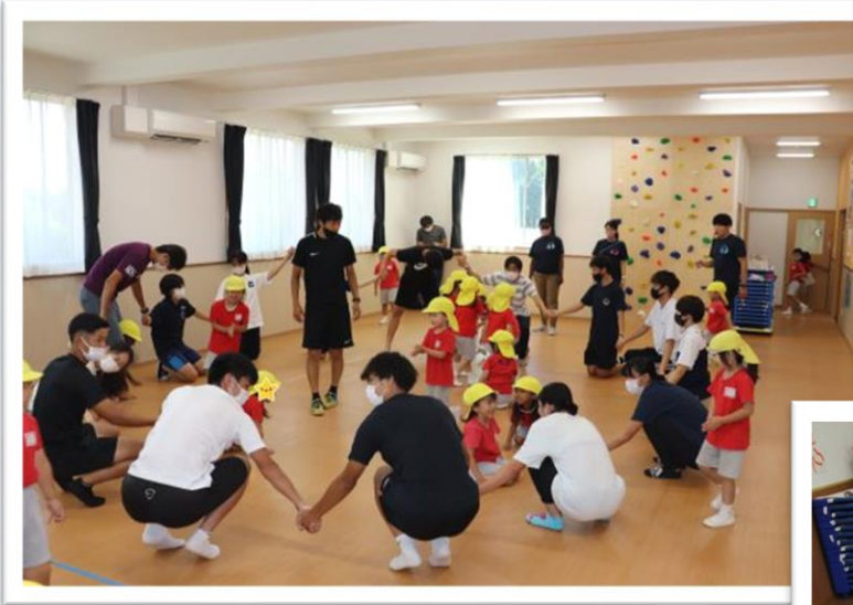
(順天堂大学 発育発達学・測定評価学研究室と連携した体育指導)

RWIが考える理想の幼児教育は、遊び感覚で学びながら成長していくことです。楽しいから身につく。感動するから心が豊かになる。子どもたちは好奇心と向上心でなんでも楽しもうとする天才です。英語、書道、音楽、体育、モンテッソーリ、食育はそれぞれ専門講師との連携で行いますので、専門知識がなくても大丈夫です。